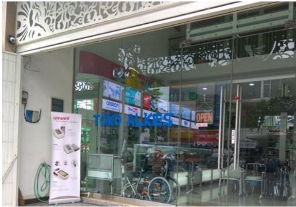
Toko Alkes Buana Husada Lestari Jl. Raya Kapas Krampung No. 196