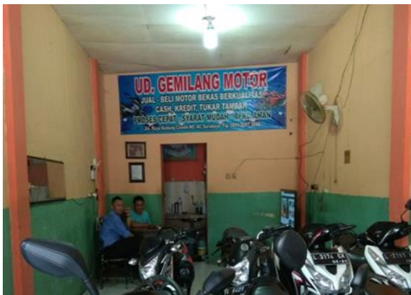
UD Gemilang Motor Jl. Raya Kedung Cowek No. 40