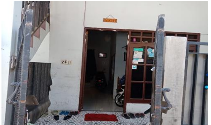
Jl. Balongsari Blok 2F No. 11