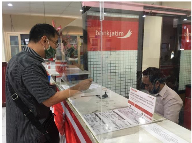
Pelayanan Loker Bank Jatim

Jumlah Permohonan Perizinan Yang Masuk Sebanyak 116 Berkas