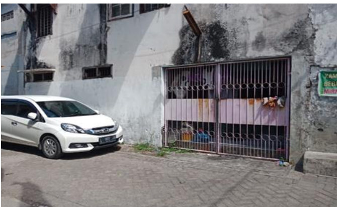
Jl. Balongsari Tama C No. 6