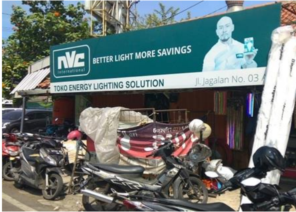
Toko Energy Jl. Jagalan 3-A