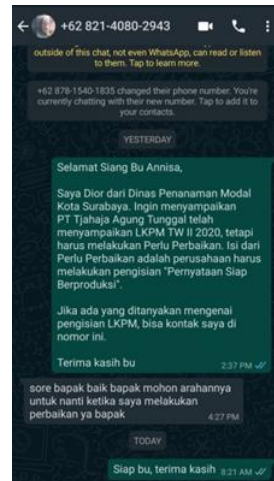
PT Tjahaja Agung Tunggal