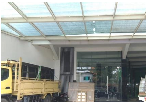
CV Jawi Glass Surabaya Jl. Kapas Krampung 22-24