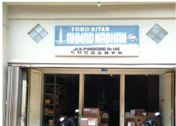
Toko Kitab Ahmad Nabhan Jl. Panggung No. 146