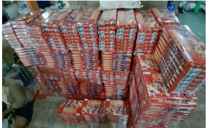
CV MENTARI TERBIT Jl. Karang Asem 16 No. 54