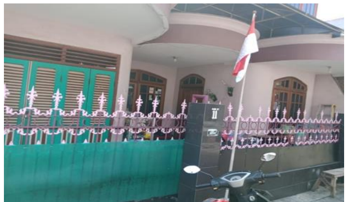
Jl. Balongsari Blok 2c No. 11