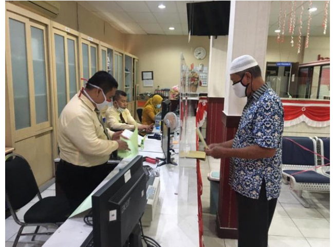
Pelayanan Loker Retribusi Izin Pemakaian Tanah