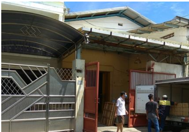
UD Kawan Kita Jl. Karang Asem 16 / 28-30