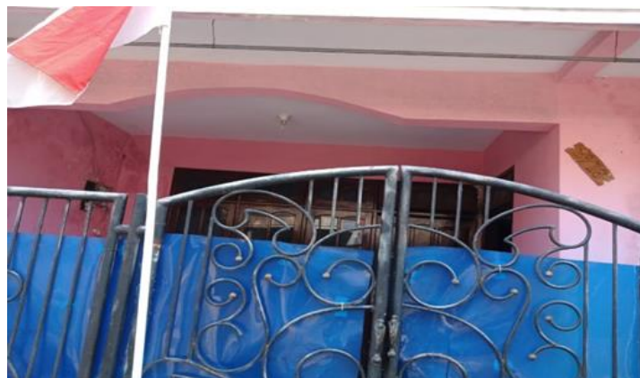
Jl. Balongsari Blok 2c No. 16