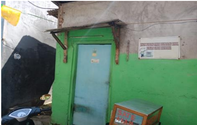
Jl. Balongsari Blok II F No. 15