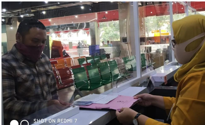
Pelayanan Loker Customer Services