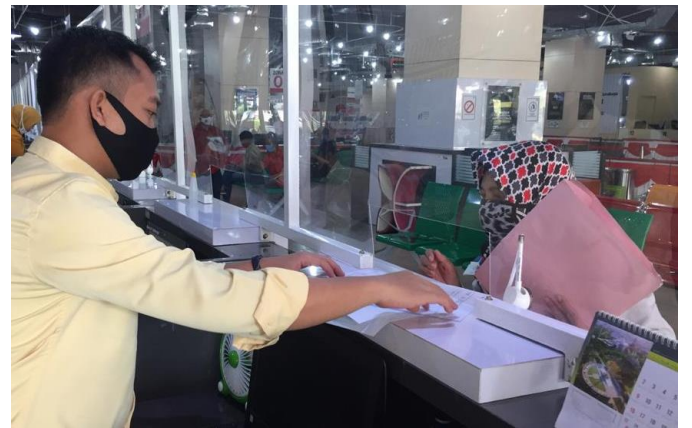
Pelayanan Loker Mandiri

Jumlah Permohonan Perizinan Yang Masuk Sebanyak 131 Berkas