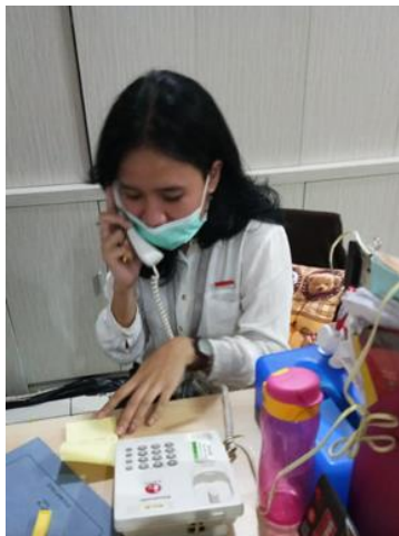
PT Aneka Boga Utama Raya