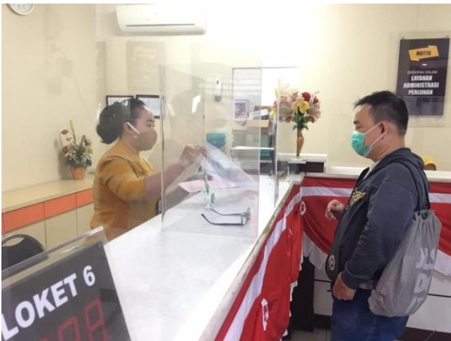
Pelayanan Loker Customer Service